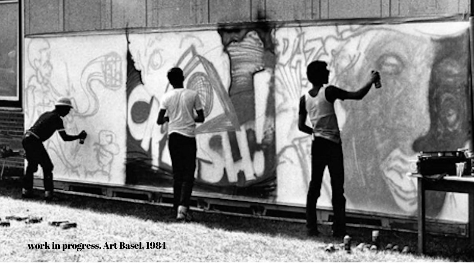
work in progress. Art Basel, 1984